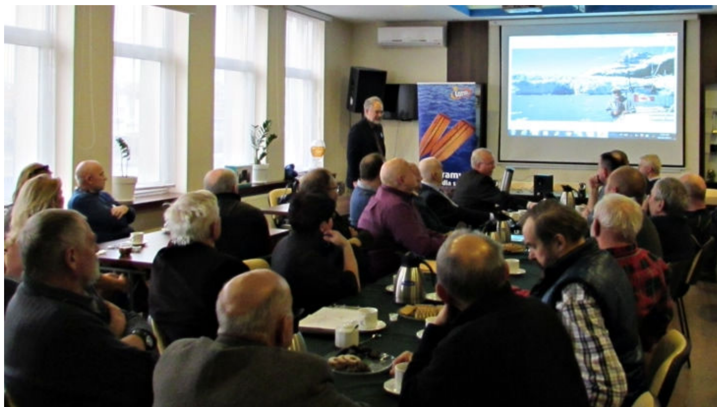
Dzień wcześniej w klubie RTW Bydgoscia w Bydgoszczy miałem prelekcje o nawigacji na akwenie kanadyjskiego wybrzeża Pacyfiku i w lodach Alaski.