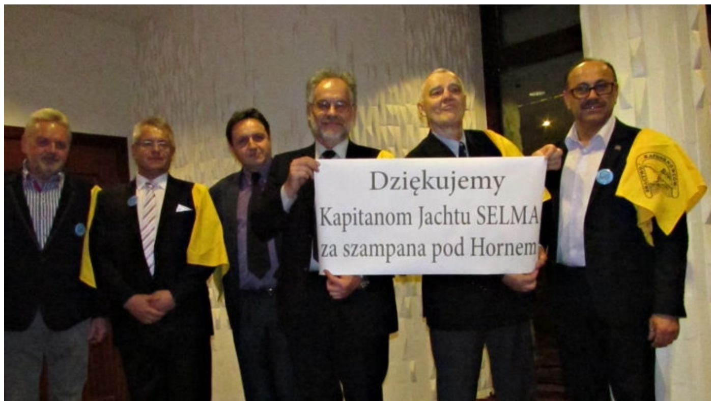
Żeglarze z kilku rejsów jachtu „Selma Expedition” dziękowali kapitanom za szampana pod Hornem.