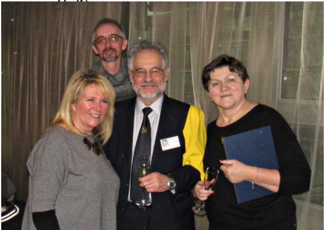
Trójka z grupy Onko-Sailing, była obecna na tej ceremonii i od razu gratulowała mi przyjęcia do Bractwa.