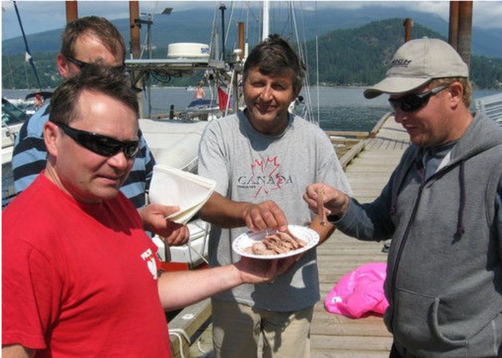
W takim miejscu i towarzystwie rybka smakowała wymiennie.

Przez następne dwie godziny ich pozycje niewiele posunęły się do przodu. O godzinie 18:00 zrezygnowały z dalszej walki, zapisały swoje pozycje i włączyły silniki. W tym czasie "Varsovia" stała już przy pomoście w Parku Plumper Cove i szykowała miejsca na zacumowanie spóźnionych zawodników.