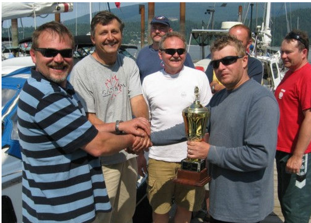
Uścisk dłoni Komandora dla pokonanej załogi "Skana Sting".